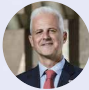
Pablo Hermoso de Mendoza Alcalde de Logroño