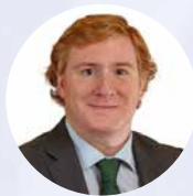
Ignacio Gragera Alcalde de Badajoz