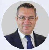
Antonio Pérez Alcalde de Benidorm