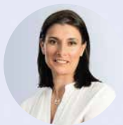
Gema Igual Alcaldesa de Santander